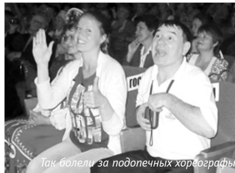
Так болели за подопечных хореографы