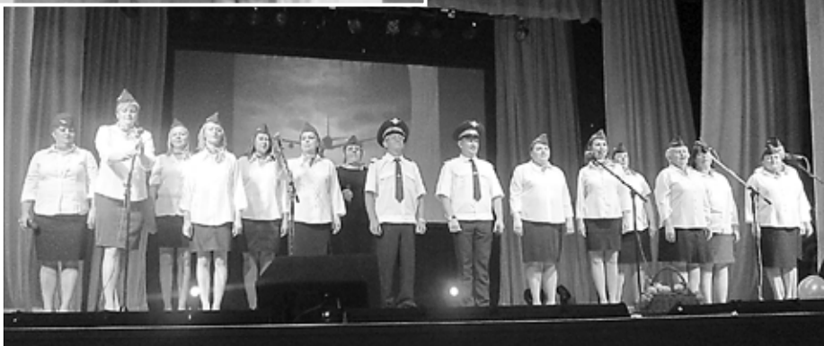
Потому что мы пилоты