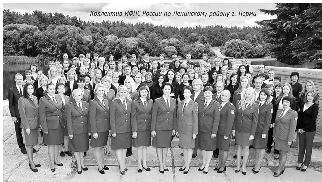
Коллектив ИФНС России по Ленинскому району г. Перми

Михаил Мишустин напомнил, что в конце 2015 года перед ФНС России была поставлена задача по созданию единого механизма администрирования налоговых, таможенных и других фискальных платежей. С 1 января 2017 года служба готова приступить к администрированию страховых взносов в государственные внебюджетные фонды. Администрирование будет построено по принципу «одного окна».