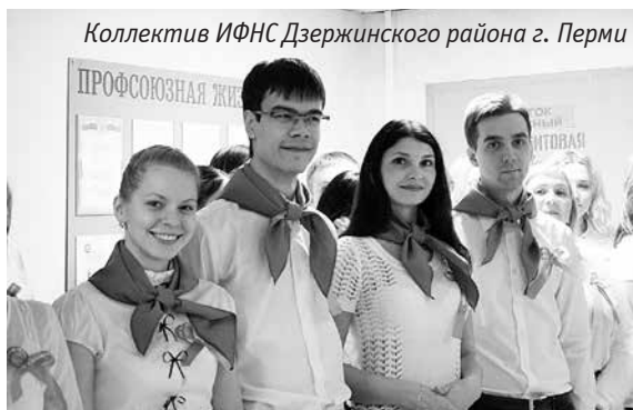
Коллектив ИФНС Дзержинского района г. Перми