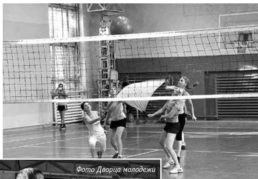
Фото Дворца молодежи

– Это спартакиада к Дню фирмы, соревнования по теннису. Автор фото – председатель первичной профорганизации Ирина Юрьевна Шелдышева.