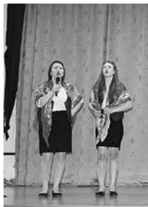
Агитбригада совета молодых педагогов Чагинского района

гоги на сцене и убеждают записных тусовщиц в преимуществах профчленства. Прозвучало что-то вроде: мол, приветствуем нашу смену – неординарную молодежь. «Стиляги» сделали вполне крепкую