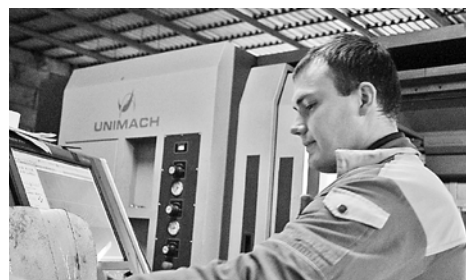
В цехе Очерского машиностроительного завода

– Обстановка в целом стабильная. Зарплату выплачивают в полном объеме, долгов по ее выплате нет. Сейчас заканчивается процедура