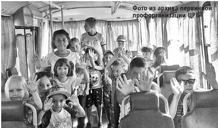
Едем в музей