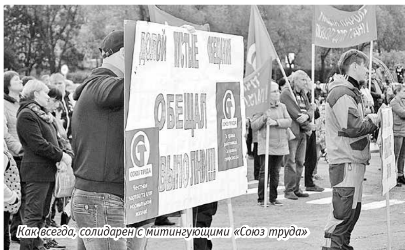
Как всегда, солидарен с митингующими «Союз труда»