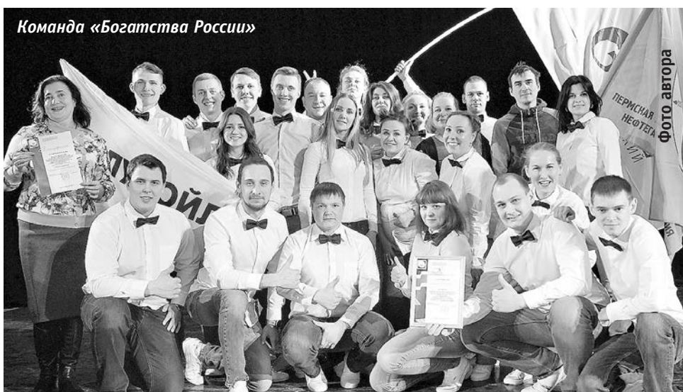
Команда «Богатства России»

По результатам конкурса-2018 впервые в его истории победителем стала команда «Богатства России» центра молодежных иници-