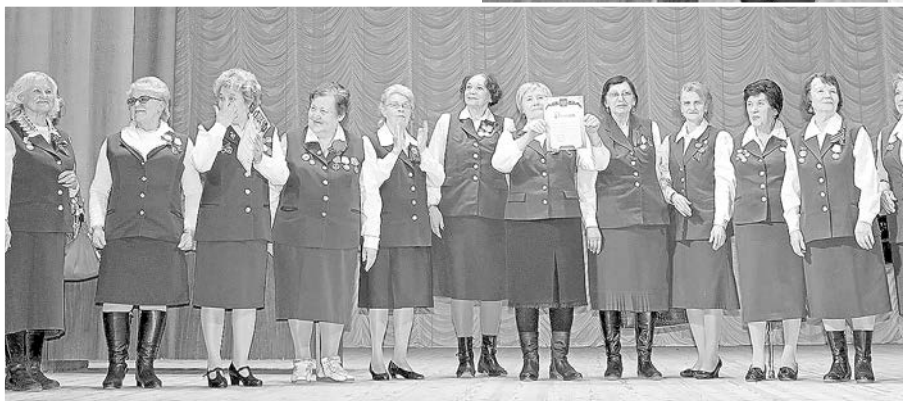
На сцене – «Фронтовичка»

хорошо известные профессиональные коллективы, такие, как Прикамский народный хор, и совсем юные артисты из детского сада. На детском литературном конкурсе малыши и ребята постарше проникновенно читали стихи и прозу о войне, поражая объемами вы-