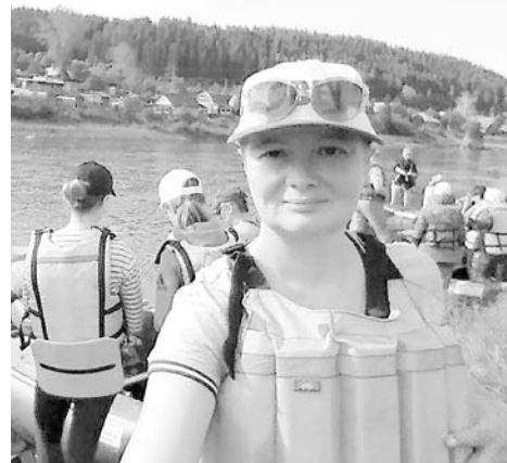
Фото из социальных сетей