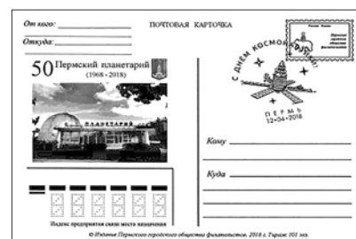
Почтовая карточка «50 лет Пермскому планетарию», апрель 2018 г. Тираж 101 экз.

Пермское общество филателистов совместно с Объединением муниципальных библиотек города Перми приглашает на выставку «295: Пермь на почтовых открытках (1900–2000)».