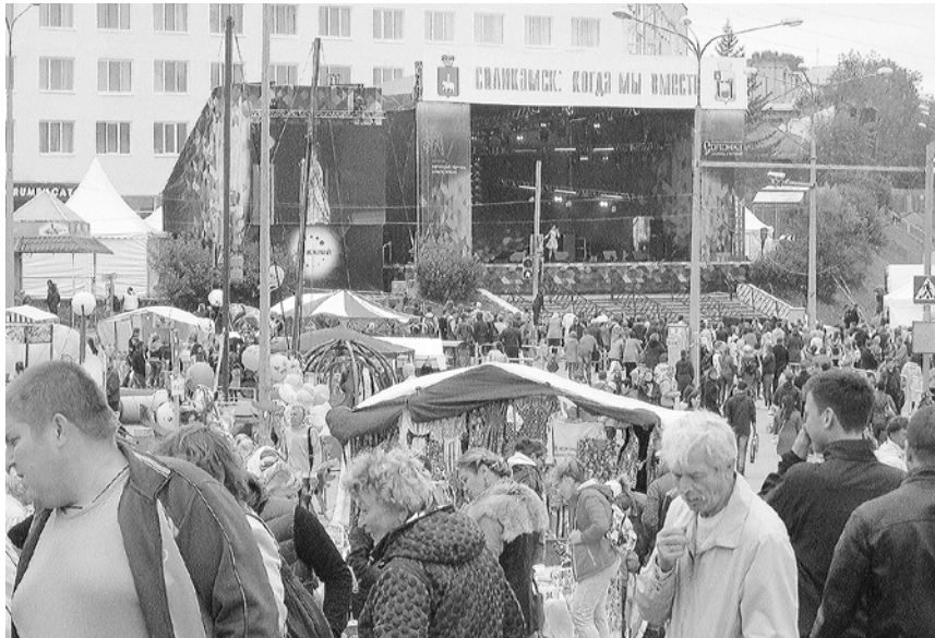
Праздник города в разгаре

В этот день при поддержке краевого министерства культуры состоялась и первый историко-культурный фестиваль «Солонка», прошедший под девизом «Окупись в историю». Объектами фестивальной программы стали, наряду с Соликамском, старинные поселения – город Усолье и поселок Орел (бывшая вотчина Строгановых), а также Березники. Каждый желающий мог ощутить свою причастность к тем или иным историческим фактам и событиям,