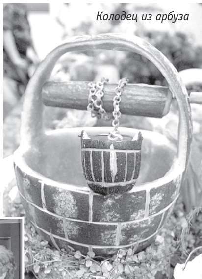
Колодец из арбуза

— Так из холодильника, — улыбается Рита Платоновна. — По весне много пистиков наморозила.