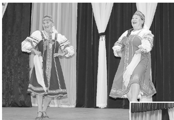
Танцевальный дуэт «Степановны»

«Широка страна моя родная...». Именно с этой песни, исполненной ансамблем Плехановской школы, началось путешествие по страницам