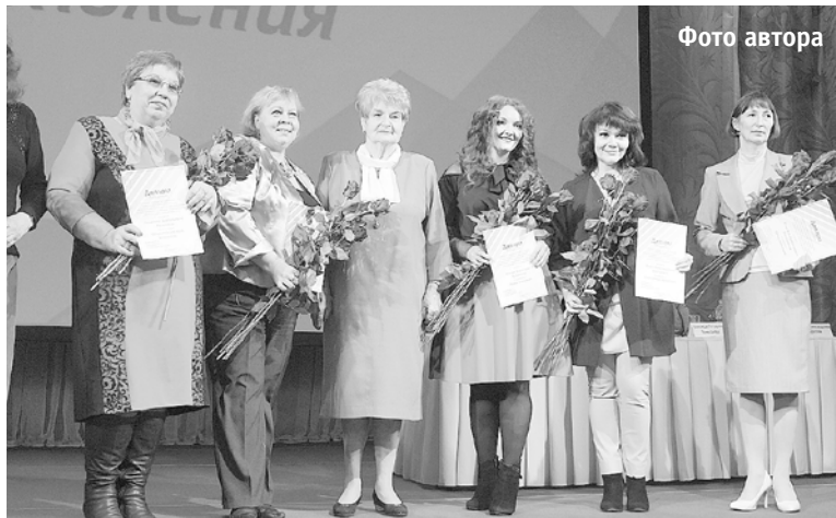
Победители конкурса СМИ

Открыла форум спикер пленарного заседания, заместитель председателя Пермского краевого совета женщин, директор Дворца детского