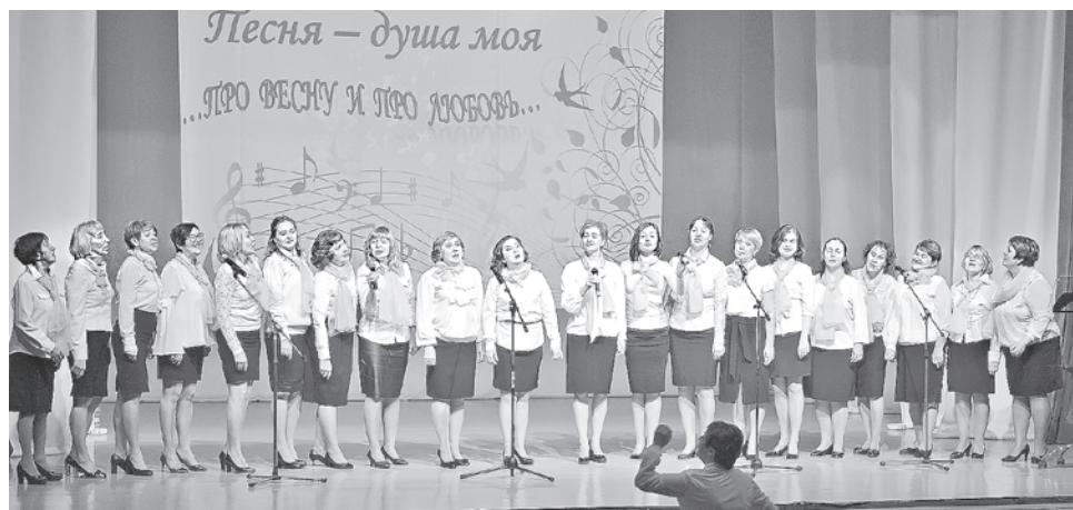
Сводный хор музыкальных руководителей дошкольных учреждений