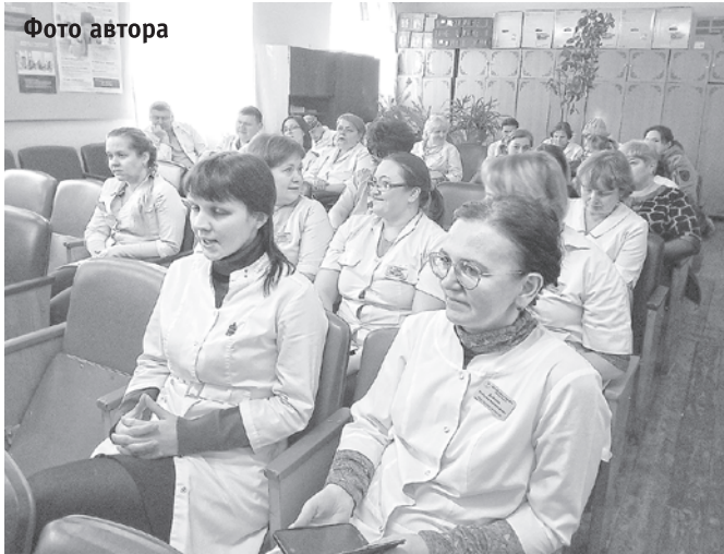
На встрече в Суксуне

открыть полноценный стационарный реабилитационный центр, а в Березовке – отделение паллиативной помощи. Появится возможность направлять в сельские стационары на долечивание выздоравливающих городских пациентов, что позволит «разгрузить» традиционно переполненный стационар в городе. Расширятся и возможности использования в городских больницах сельских «узких» специалистов. Например, в ходе поездки в Суксун глава кунгурского здравоохранения провел переговоры с хирургом ЦРБ о совместительстве в «Кунгурской больнице». Интерес оказался взаимным: городской больнице нужны кадры, а сельскому хирургу – профессиональный рост.