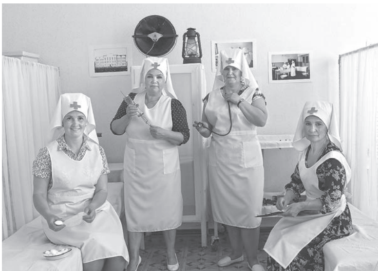
Сотрудники музея имени П. Ф. Шардакова в интерьере реконструированной госпитальной палаты

ПРОФЕССИОНАЛЬНЫЙ ПРАЗДНИК – ОТЛИЧНЫЙ ПОВОД ДЛЯ ВСТРЕЧ, ДРУЖЕСКОГО ОБЩЕНИЯ