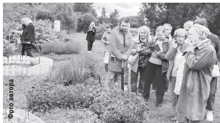
Члены клуба «Садоводу» в соликамском дендрарии

Газета отпечатана в ООО «Кунгурская типография», г. Кунгур, ул. Криюлинская, 7. Печать офсетная. Объем 2 п. л. Тираж 5600 (+200 экз. — подписка на электронную версию). Заказ № 3547