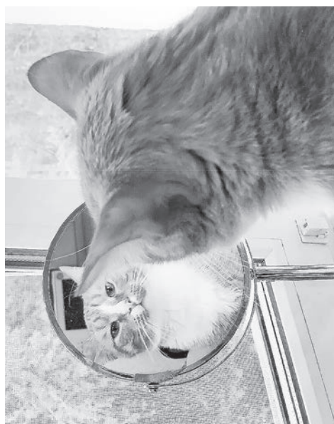
Глядя в зеркало

«...процесс бумажный очень сложный: Готовят массу, варят клей, Добавки разные мешают И на волшебную машину отправляют. И словно как по волшебству, Из этой смеси там бумагу получают».