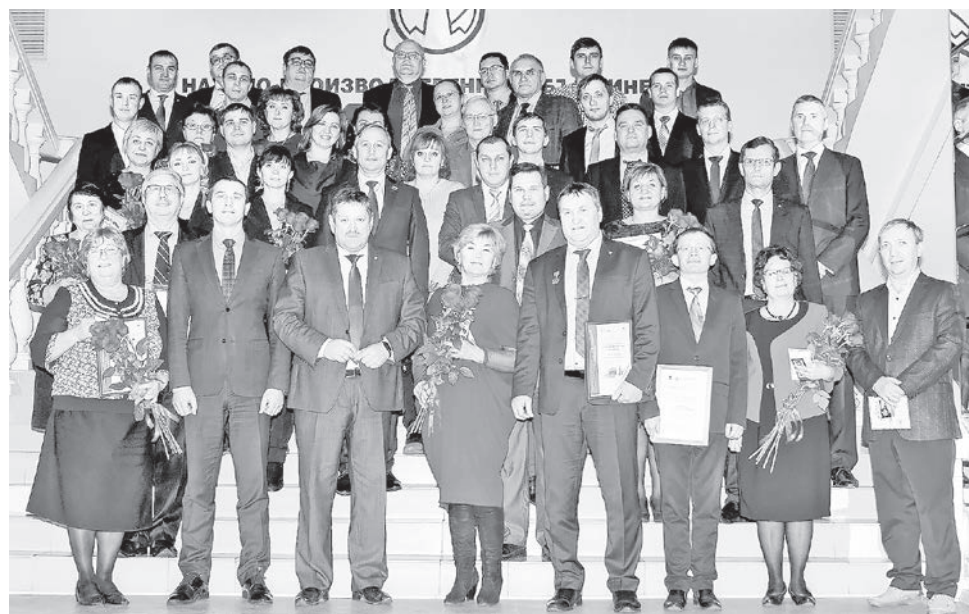
Лучшие работники предприятия по итогам 2020 года

ребенок оздоровлен в загородных детских центрах и санаториях, родителям выплачена компенсация 255 тыс. рублей (на 1 сентября)