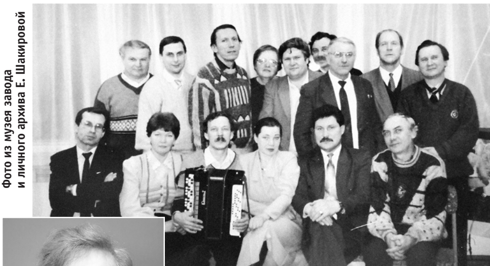
Члены забастовочного движения