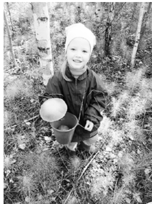
Автор Екатерина Попова из ППО Соликамского завода «Урал»