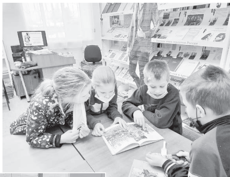
Дети в библиотеке