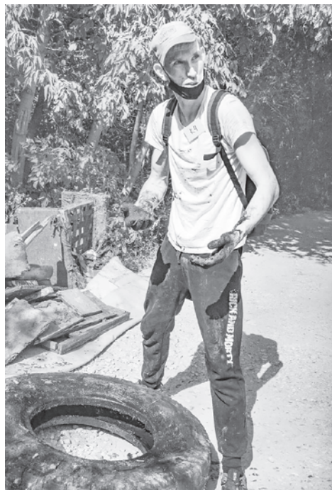
На «Чистых играх»