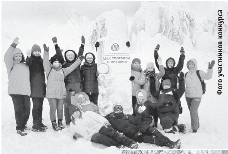
Фото участников конкурса

Сейчас практически каждый обеспечен хорошей камерой в телефоне, поэтому и зимой можно сделать отличные фото.