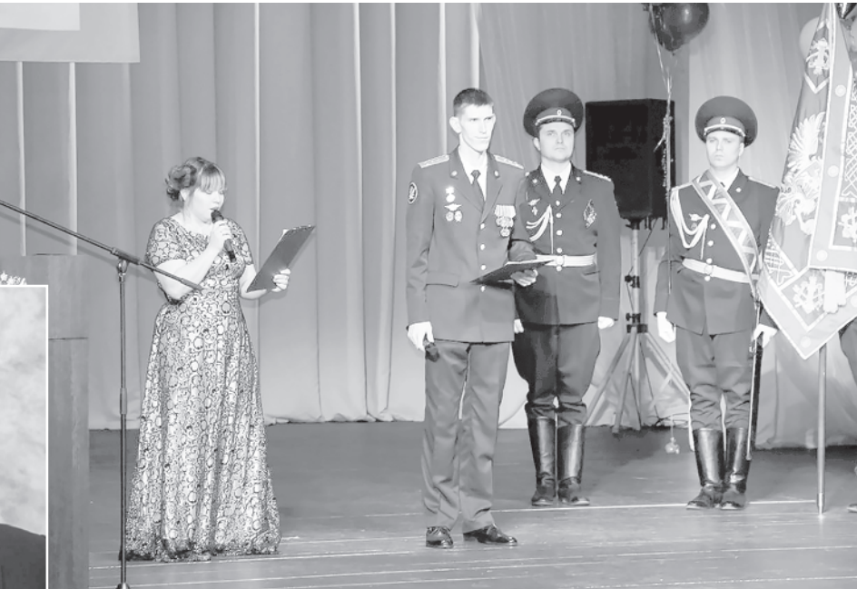
Семейное дело. Мероприятие ведут муж и жена