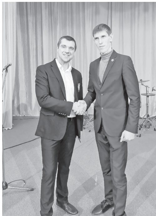
С Сергеем Куприком, которого называют золотым голосом группы «Лесоповал»