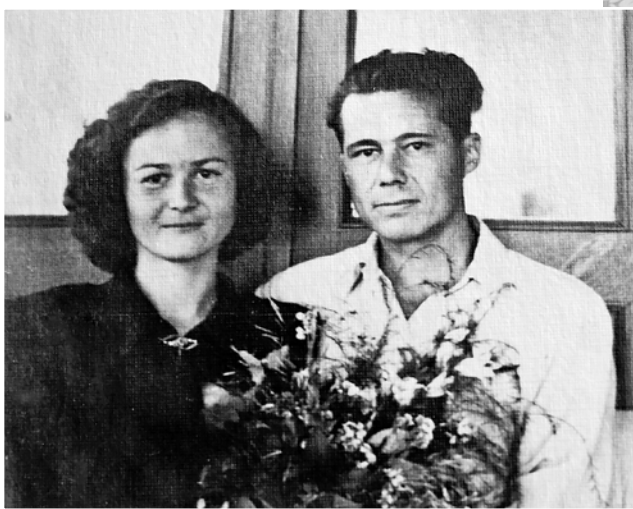
1954 год. В ЗАГСе Ленинского района г. Молотова зарегистрирована новая семья

не хватало, так как потратились при переезде, то мы с мамой пошли продавать на рынок наши две красивые шали, белую и серую. Женщины подходят, смотрят и нахваливают: «Ох, уж немецкие шали хороши». А маме обидно стало, она говорит: «Какие немецкие шали? У меня муж без вести пропал, сын погиб. Вот девочка, которая эти шали вязала...». А мне тогда 13 лет было! Не поверили те женщины, ушли. Но платки мы все же продали и корову купили.