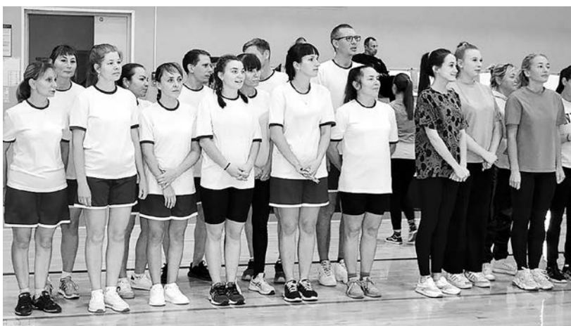
Команда Комсомольского детского сада

Фестиваль спорта прошел в Кунгуре с февраля по октябрь и состоял из шести этапов: плавание, лыжные гонки, ГТО, парковый волейбол, «Семейные старты» и «Веселые старты». Средства на фестиваль были получены благодаря победе в конкурсе социальных и культурных проектов Кунгурского муниципального округа. Фестиваль традиционный, но периодически в нем появляются новинки. В этом году, например, впервые провели «Семейные старты», которые организаторы отмечают как очень важные для учительских семей. Как правило, дети в таких семьях быва-