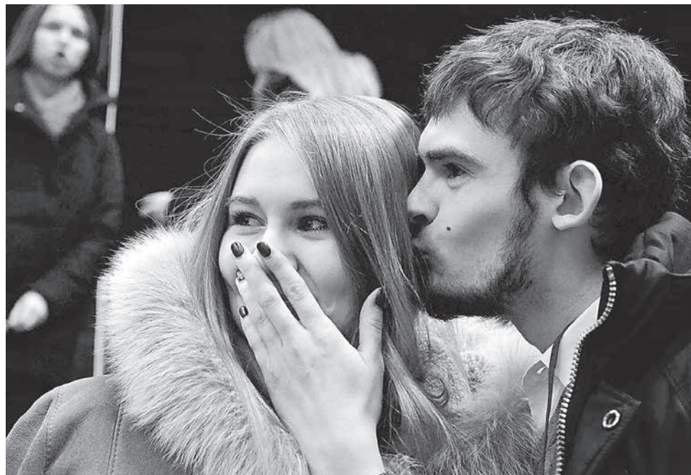
Фото Владимира Бикмаева, чья персональная фотовыставка продолжает работу в Пермском крайсовпрофе

Желание встречать в штыки новые инициативы заложено в природе каждого человека, потому что любая система стремится хранить