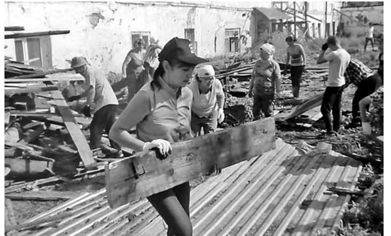
Моменты, вошедшие в историю проекта

Как будет жить совет семейной взаимопомощи, решат сами общественники. Ясно одно: дело начато очень нужное и важное.