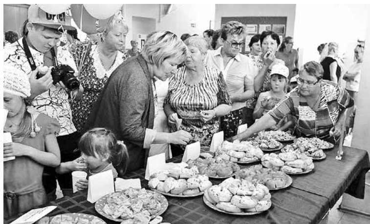
Дегустация продукции Острожского сельпо