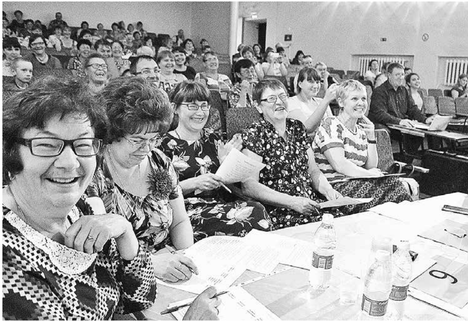
Весело было даже в жюри

– Продавцы в нашем районе соревнуются впервые. Вообще это такая отрасль, представители которой не очень любят, скажу даже больше – страшатся светиться на людях. Тем более – в глубинке. Поэтому мы проводим конкурс среди тех, кто откликнулся на пред-