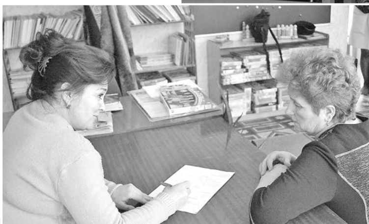
Воспитатель выступает в профсоюз