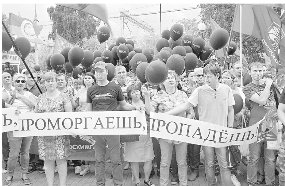
Активисты краевой организации Росхимпрофсоюза пришли на митинг 10 июля с черными шарами

— Правительство повышает пенсионный возраст, то есть заставляет всех граждан дольше работать. Но дело в том, что сегодня трудятся те, кому позволяет здоровье, у кого есть возможности, кто востребован (пока!) в профессии. Вот как у нас в госпитале, на