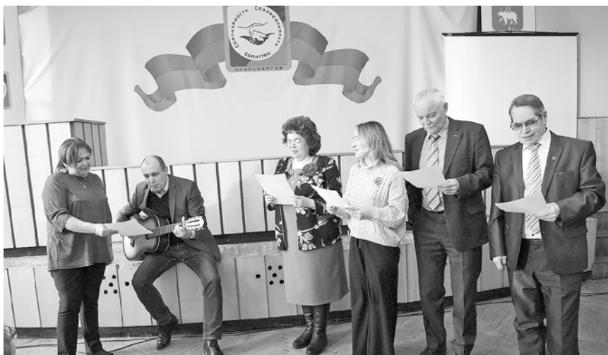
«Профкурьер» - отличная газета! (на мотив песни «Светит незнакомая звезда»)

• «ПК» выражает глубокую признательность всем председателям членских организаций, профсоюзным активистам, кто лично или заочно поздравил редакцию с юбилеем газеты! Ваши теплые слова, прозвучавшие в эти дни и которые, конечно же, являются неотъемлемой частью любого торжества, мы расцениваем как авансовую оценку нашего труда. А успех возможен только в нашем общем тесном взаимодействии. Еще раз большое спасибо всем! И – за работу, дружбу, в новое десятилетие!