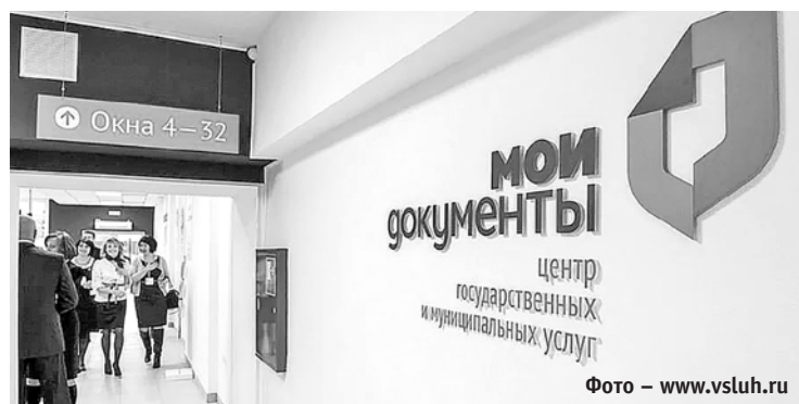
Фото – www.vsluh.ru

Информация и фото – Пермского регионального отделения Фонда социального страхования РФ