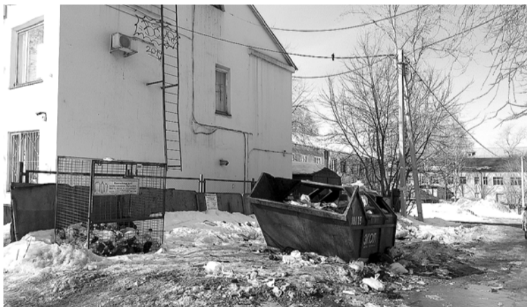
Эта фотография сделана в минувшую субботу в центре Перми, в одном из дворов на улице Клары Цеткин

Еще интереснее ситуация в частном секторе. Особенно в деревнях. Плохо себе представляю, как будет производиться вывоз мусора, например, из деревни, где постоянных жителей пять или десять человек. Непонятно, как можно в таежных местах устанавливать мусорные