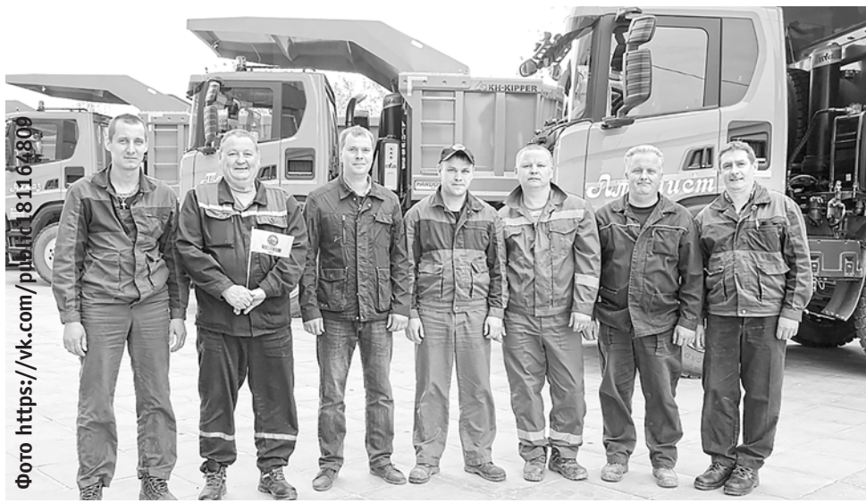
На новой технике приятно работать

Напомним, что в конце прошлого года ПАО «ГЦЗ» перешел в собственность ООО «Южно-уральская горно-перерабатывающая компания» (г. Новотроицк). Новые руководители провели серьезную оптимизацию производства. Так, автопарк предприятия уже пополнился карьерными самосвалами и современными цементовозами, благодаря чему появилась возможность самостоятельно доставлять продукцию покупателю. Также завод начал переговоры с двумя зарубежными компаниями, специализирующимися на проектировании цементных предприятий. Основная цель — переход на сухой способ производства цемента. Все эти действия направлены на построение единой линии качества производства продукции, которая