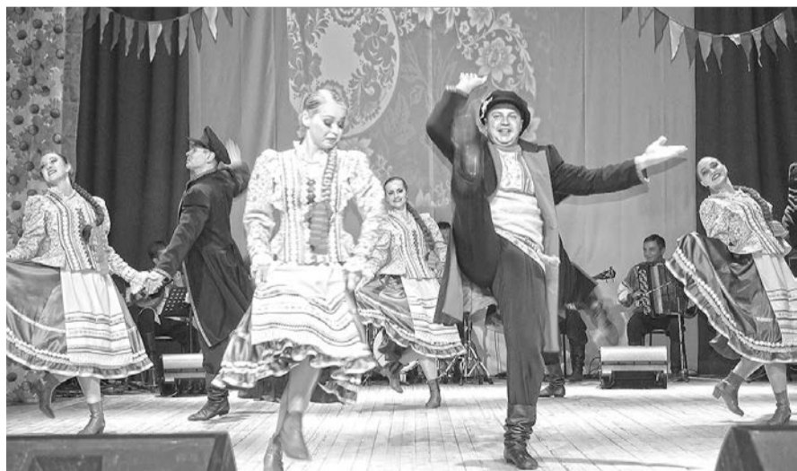
На сцене – известный ансамбль «Ярмарка»