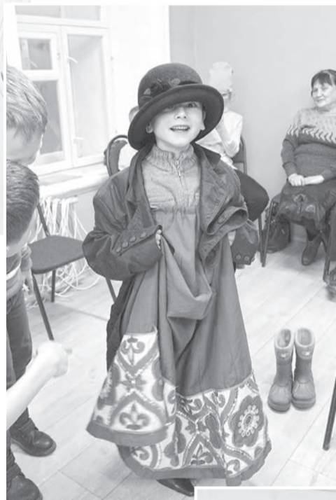
Переодевание на скорость и с помощью друга