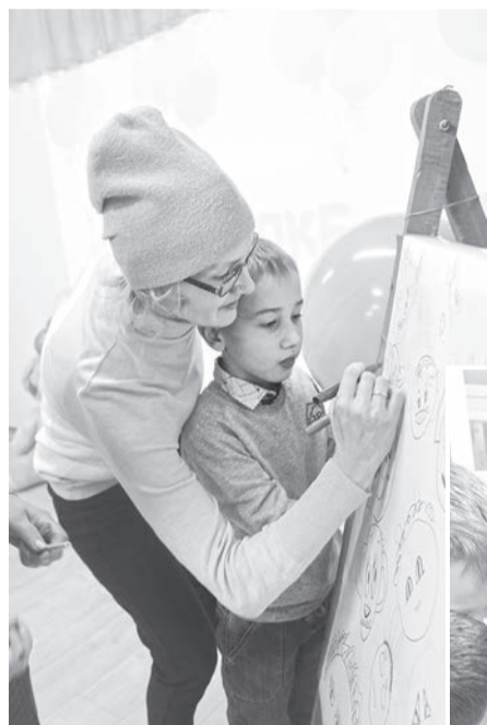
Рисуем смешные рожицы вместе с мамой

Плодотворному сотрудничеству членов первичной профсоюзной организации Оханской центральной районной больницы (ЦРБ) и активистов профсоюзного движения из городской библиотеки уже более трех лет.