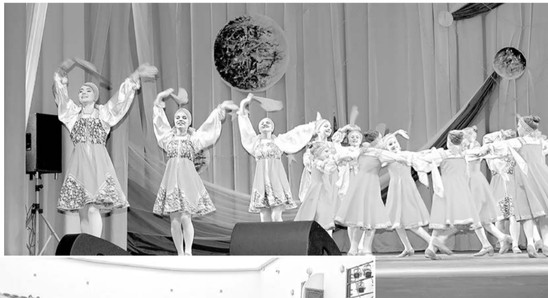
Какой ДК Калинина без «Калинки»!

Постепенно дворец оживал. Был произведен необходимый ремонт в уцелевших помещениях, в них вернулись творческие кружки. В фойе устраивались разнообразные мероприятия. Общественные работы были закончены и в большом театральном зале. Оставалось самое сложное и самое дорогое – оснастить зал световой и звуковой аппаратурой и мебелью. На это требовались