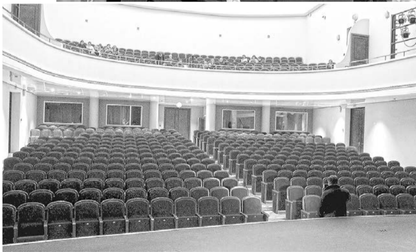
Новый вид театрального зала

огромные средства, которых у предприятия не было.