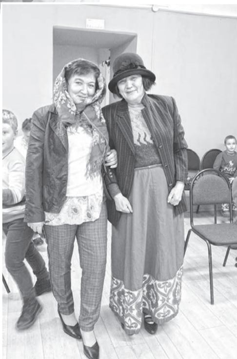
Бабушки тоже ох какие модницы!

— Ребята правильно отразили заданную тематику в стихах, рисунках и поделках, — отмечает председатель профсоюзной первички