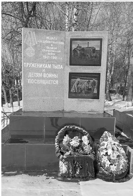
Памятник труженикам тыла и детям войны на центральной площади