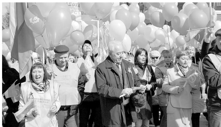
Первомайская демонстрация (2019 год)

Молодежный квест «На пределе» (2019 год)