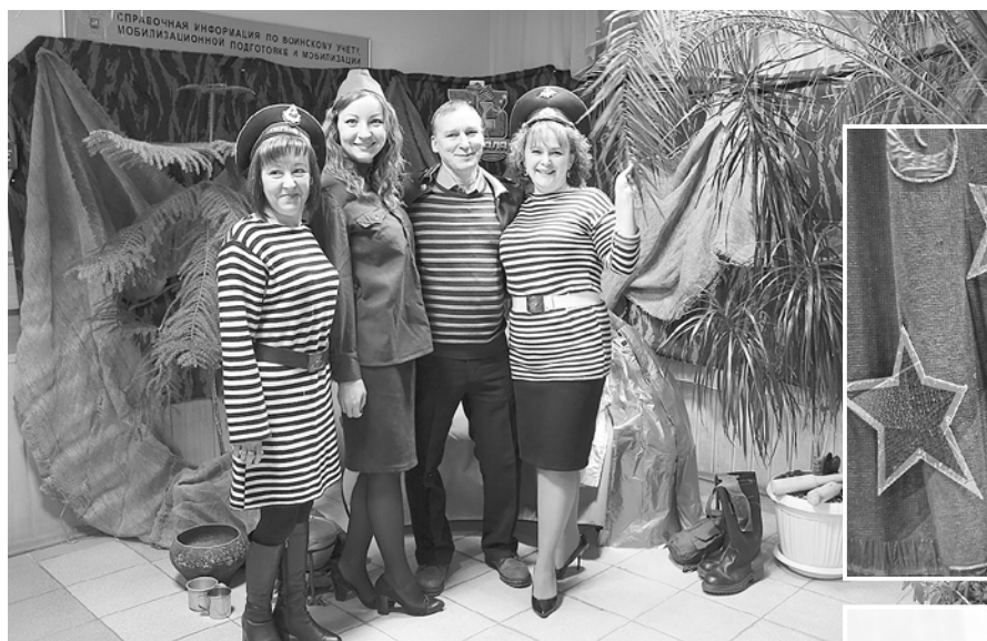
Поздравление с Днем защитника Отечества (2020 год)

Действует коллективный договор, заключенный на 2019-2021 годы