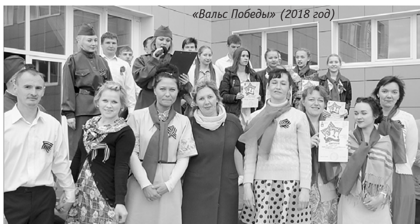
«Вальс Победы» (2018 год)

Выписали на второе полугодие 2020 года 40 экземпляров газеты «Профсоюзный курьер»