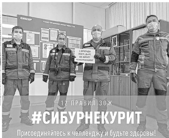
Участники челленджа #СИБУРНЕКУРИТ

Любимые майские праздники сотрудники «Сибур-Химпром» также провели онлайн, публикуя фотографии с домашних первомайских демонстраций (некоторые из фото даже попали на страницы газеты «Профсоюзный курьер»), а также украшенные к 9 Мая «Окна Победы», фотоснимки ветеранов и т. д. Для