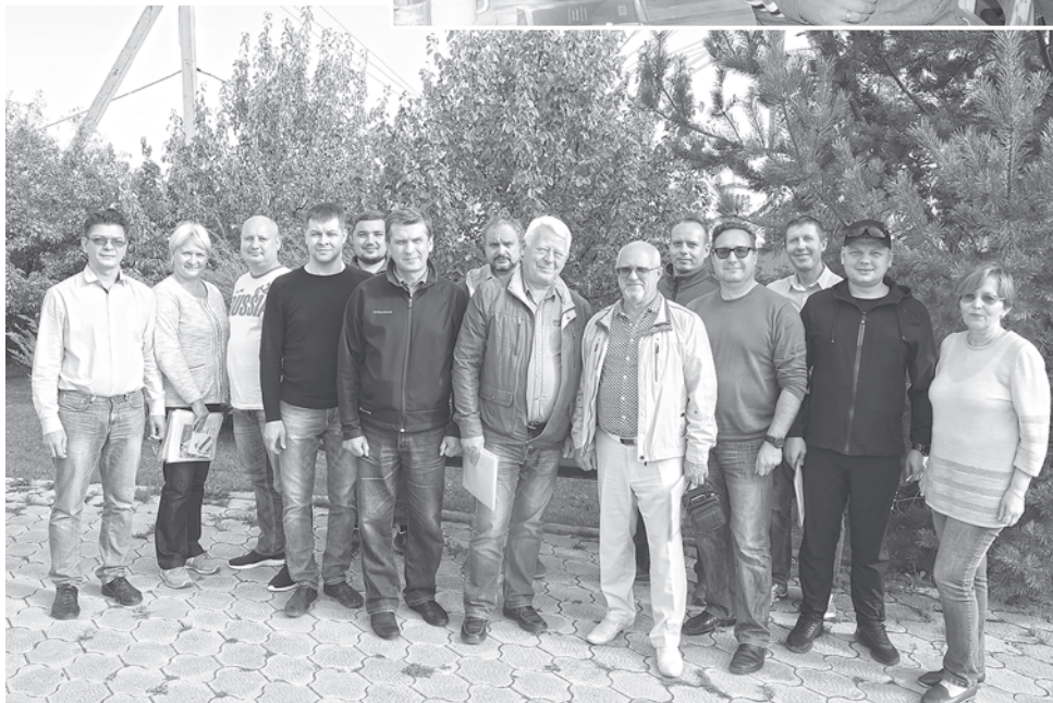
Фото на память. Профсоюзные эксперты, которые определяют правозащитную деятельность профобъединения

ний проводить такой осмотр и о недопуске к работе в связи с непрохождением обучения по охране труда из-за того, что обучающие центры не работают в связи с коронавирусной инфекцией.