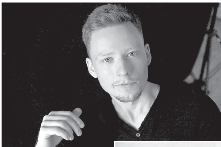
Фото предоставлены автором