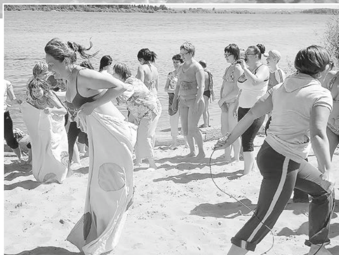
Профессиональный праздник – День российской почты