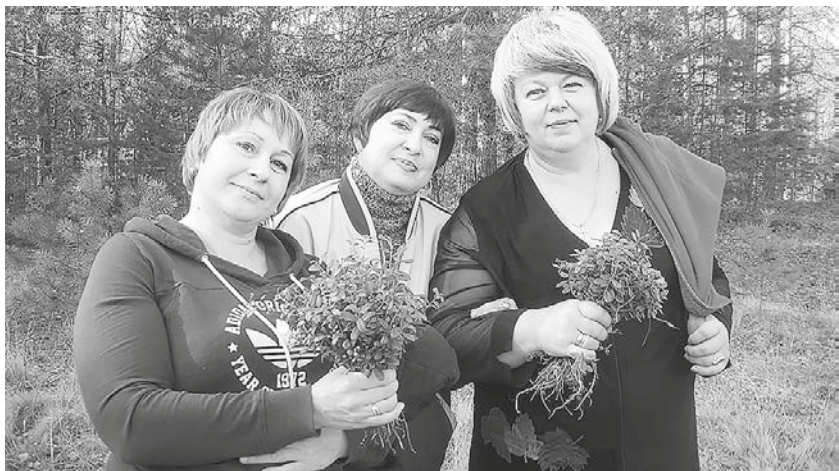
Выезд на природу

Первичная профсоюзная организация Березниковского почтамта общероссийского профсоюза работников связи