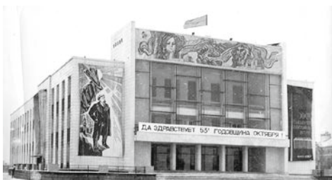
Фото 50-летней давности