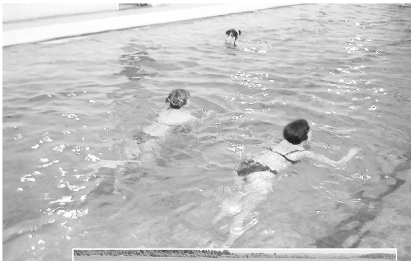
Оздоровительные занятия в бассейне

Производятся единовременные выплаты к юбилейным датам (50, 55, 60 лет), на посещение больного в стационаре, родителям будущих первоклассников. Закупаются абонементы в бассейн, билеты в театр и на концерты и т. д.