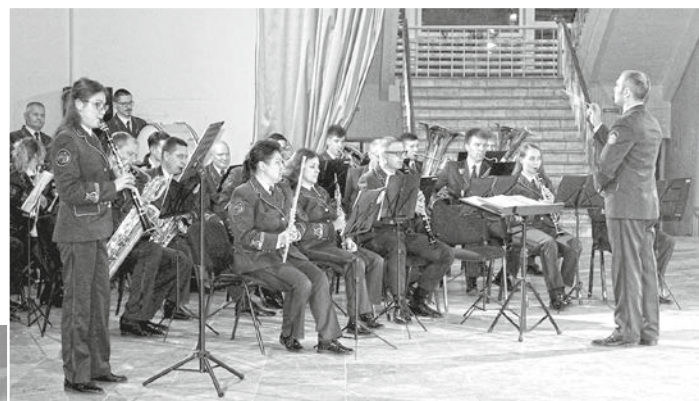
Губернский оркестр играет в фойе ДК имени Калинина

Это случилось в октябре 2019 года, практически за год до юбилея дворца. Выступая на сцене, и юные артисты, и высокие гости, приехавшие на торжественное открытие зала, в один голос говорили — ровно через год, в золотой