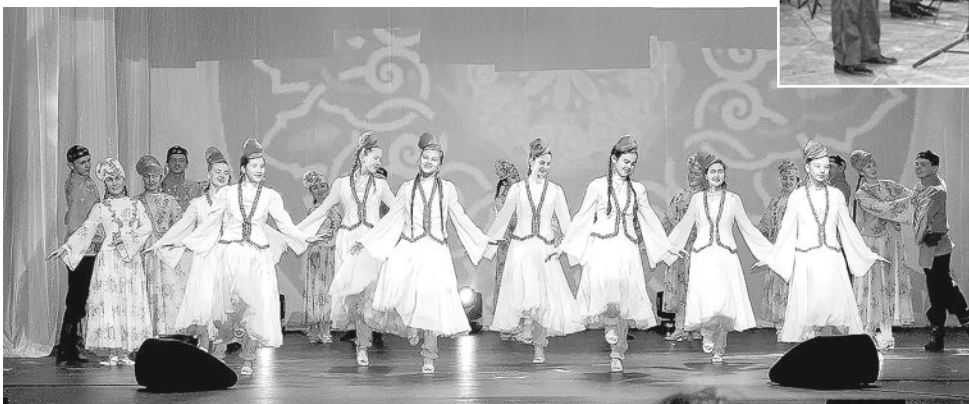
На сцене ансамбль татарского танца «Гузель Чулман»

60 кубометров. Этот этап работы продолжался два месяца. Каждый день на объект кроме работников специализированных строительных организаций выходили по 25–30 помощников из цехов и отделов предприятия. Это не считая тех, кто спасал экзотические растения зимнего сада, просушивал книги из библиотеки. К концу 2000 года была восстановлена крыша, запущен тепловой контур, что позволило дать в здание дворца отопление и предотвратить его дальнейшее разрушение.