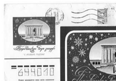
На армянском языке

Посетители увидят часть коллекции музея, состоящей из поздравительных открыток, которые в 1970–1990-е годы печатались на Пермской фабрике Гознака для республик,