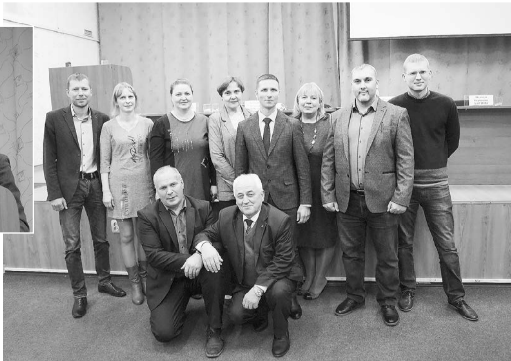
Профактив ППО «Мотовилихинские заводы». Фото на память

ционные технологии, в том числе – соцсети. Рассматриваем информационную работу как важный элемент мотивации профсоюзного членства, особенно среди молодежи.