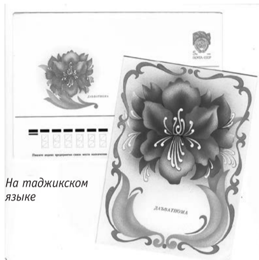
На таджикском языке