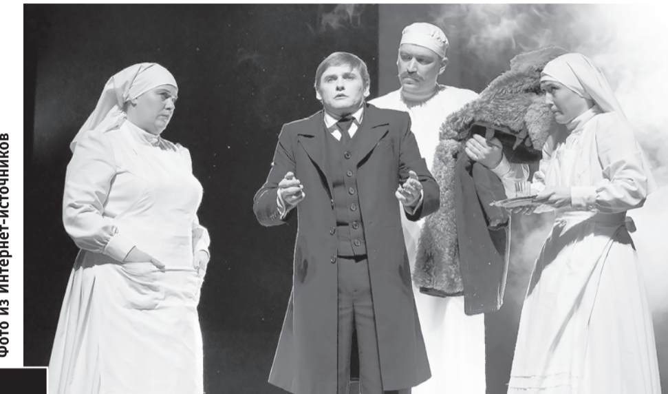
Сцена из спектакля «Врач» по произведениям Михаила Булгакова, премьера состоялась в феврале

«Акция для членов профсоюзов предприятий города! На этой неделе вы сможете приобрести билеты на спектакли театра по сниженной для вас цене. Приобрести билеты можно только в кассе театра, при предъявлении профсоюзного билета, либо попросить председателя своего профсоюза внести себя в списки, которые будут переданы в кассу театра». Так в течение трех дней члены профсоюза могли посмотреть три спектакля – «Потерпевший Гольдинер», «Визит дамы» и «Жареные