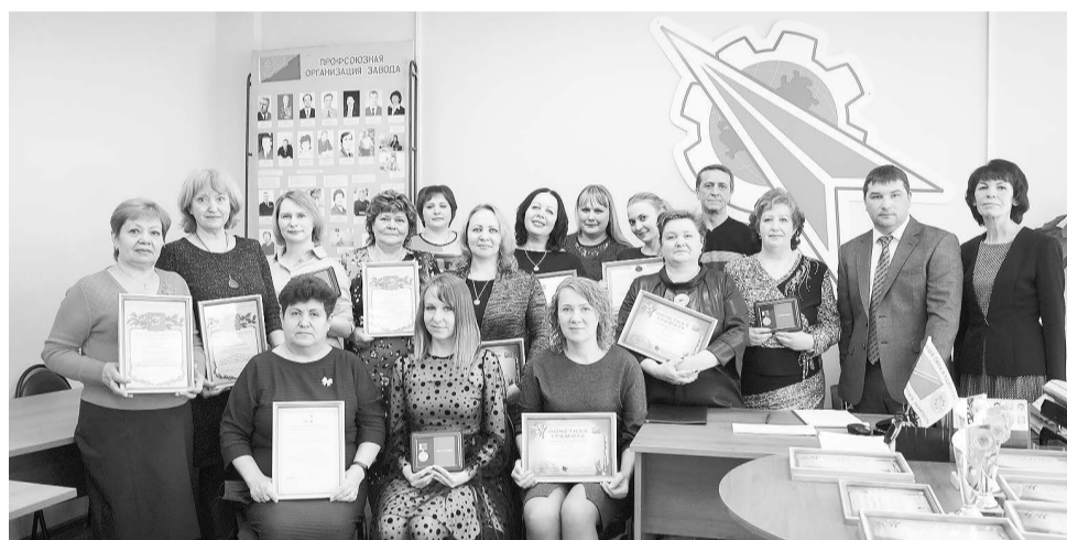
Председатели цеховых комитетов