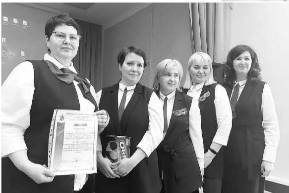
У команы воспитателей детского сада «Театр на Звезде» 2-е место

Молодцы все – учителя и воспитатели! Они не только учат и воспитывают наших детей, но и сами активно повышают свой интеллектуальный уровень, обучаясь на курсах и семинарах,