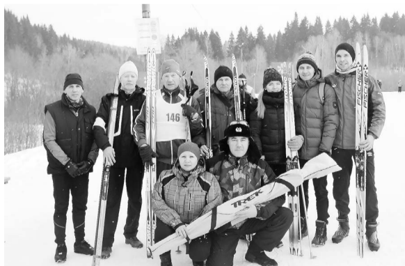
Цех на лыжне

Членам профсоюза к юбилейным датам и при награждении производятся единовременные выплаты от 1 500 до 5 000 рублей (в зависимости от профсоюзного стажа)