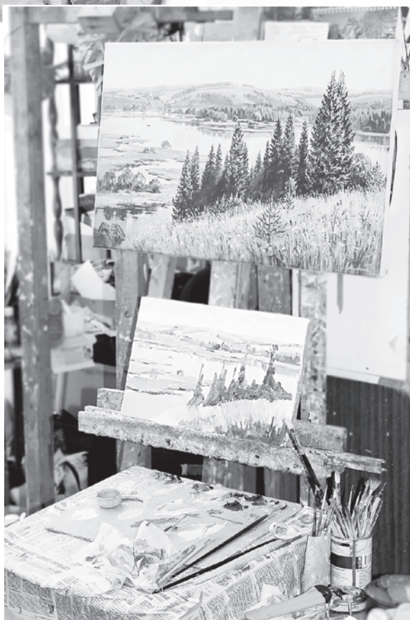
Работа художника и работа над копией