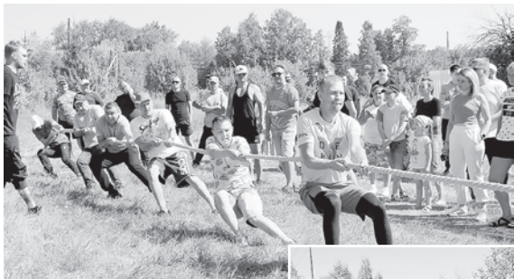
Перетягивание каната — обязательный элемент массовых праздников

У команды службы информационных технологий, вытянувших при жеребьевке поэму «Бородино», на поляне пушка стреляла разноцветными конфетти, а в гастрономическом