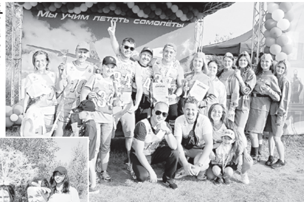
Чудо-уборы цеха № 51