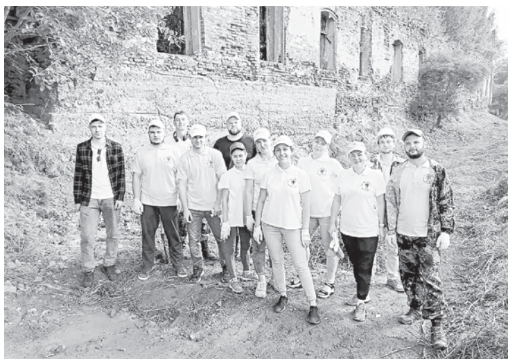
молодежь «Азота» косит траву, прибирает территорию