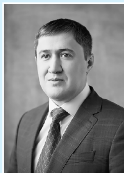
Дмитрий МАХОНИН, губернатор Пермского края

Спасибо вам за профессионализм, ответственность и неравнодушие. Желаю здоровья, сил и вдохновения!