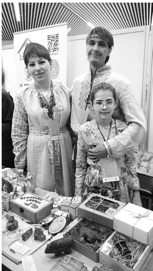
Творчество для Корепановых – дело семейное