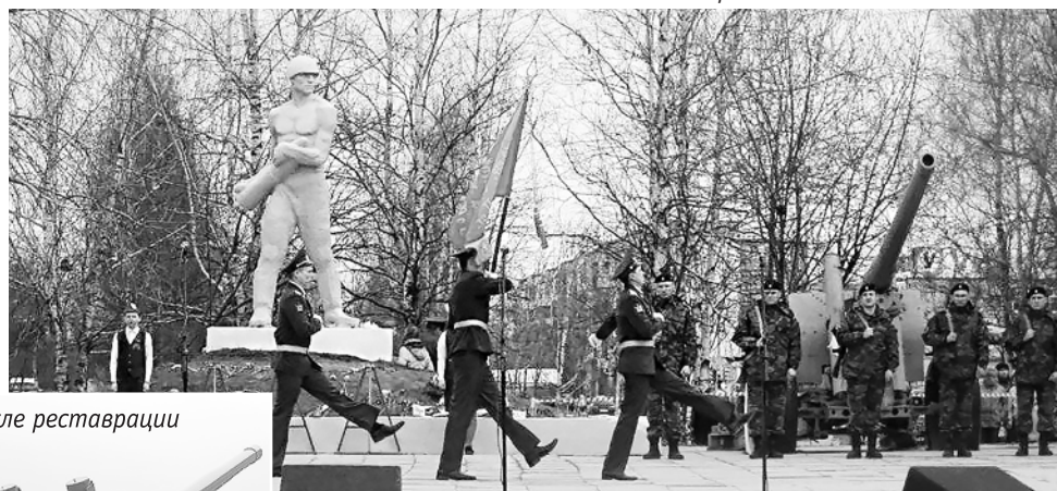
Пушка после реставрации

А теперь расскажем историю одной пушки, установленной в качестве памятника в центре