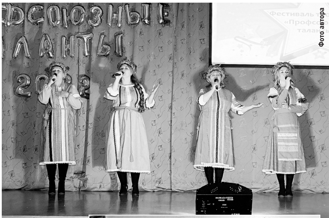
«Метелица» на сцене