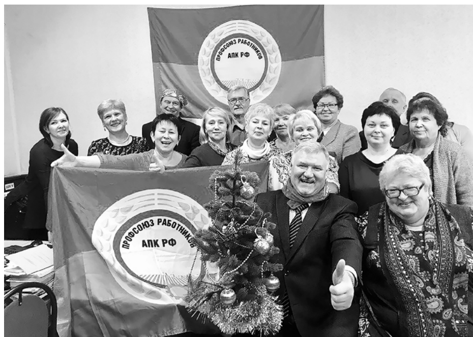
Заседание президиума крайкома профсоюза