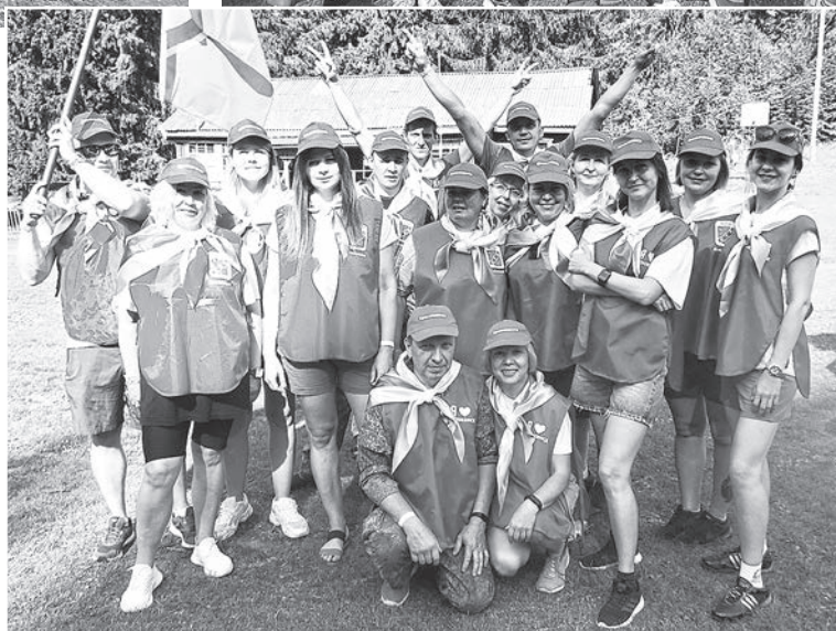
Команда «ENERDGY», третье место

стингу. В творческих конкурсах каждая команда-участница имела возможность сказку сделать былью, превратив сюжет известных русских сказок в современность.