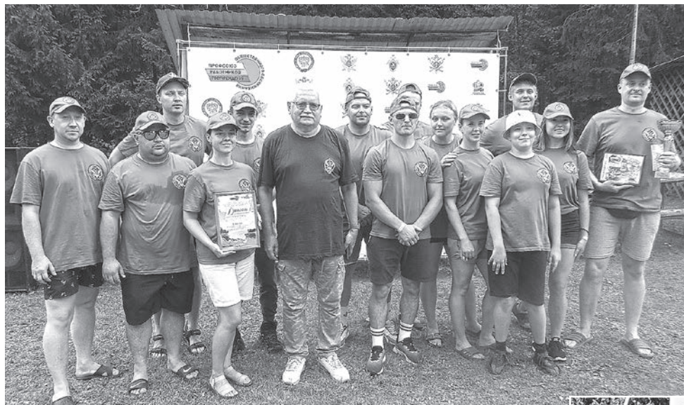
Победители. Команда «Добро пожаловать!»

Недалеко от Краснокамска на территории лыжной базы «Олимпийский» состоялся IX краевой культурно-спортивный туристический фестиваль «Профсоюзный Олимп – 2023».