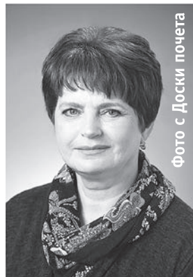
Фото с Доски почета