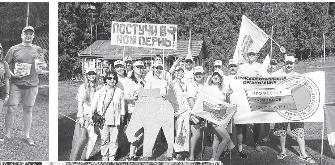
Команда «Постучи в мою Пермь», второе место

Конкуренция была острая – команды, набирая очки, шли буквально плечом к плечу, с удовольствием участвуя в спортивных и творческих конкурсах. Не оставил равнодушным болельщиков конкурс визиток «Пермь – 300. Все реально!». Спортивные конкурсы включали в себя туристическую полосу, соревнования по дартсу и стрельбе из пневматической винтовки, ориентирование, командную эстафету «Однажды на тропе» и соревнования по мас-