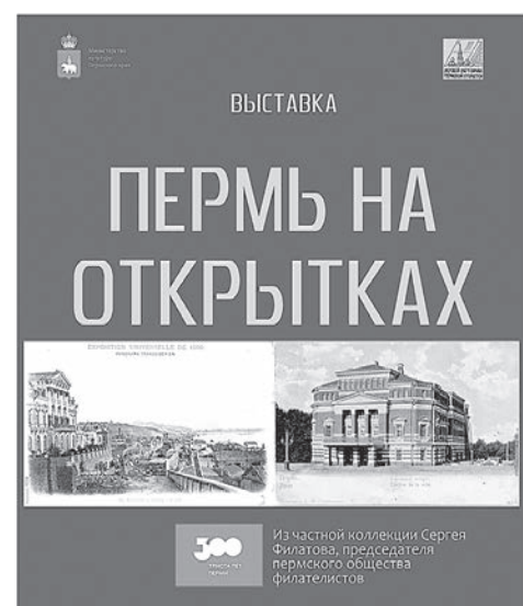
Где: Музей истории Пермского порохового завода Когда: 17 июля – 31 августа 2023 года

Информация и фото музея истории пермской открытки