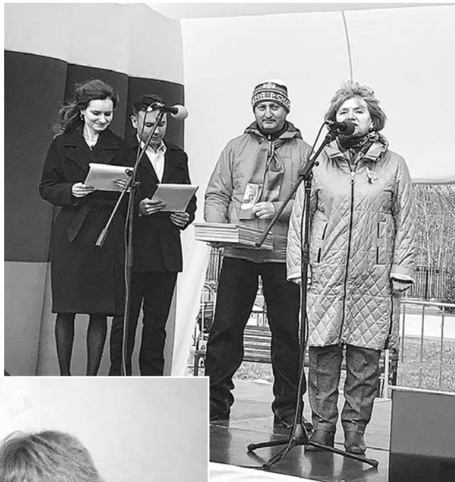
1 мая 2023 года – праздничное городское мероприятие для членов профсоюза

По окончании школы, не набрав нужного количества баллов в инсти-