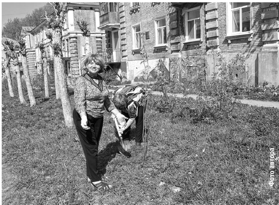
Высадка рябин членами координационного совета организаций профсоюзов на Профсоюзной аллее

Причем проходили они с трибуны здания городской администрации, а выступали мы,