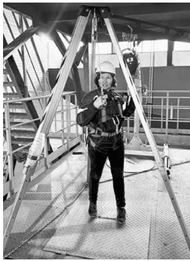
Тренажерный центр по охране труда при работе на высоте, единственный на северо-западе

Средняя зарплата работников «ФосАгро» – 156 000 рублей. Текучки на предприятии практически нет.