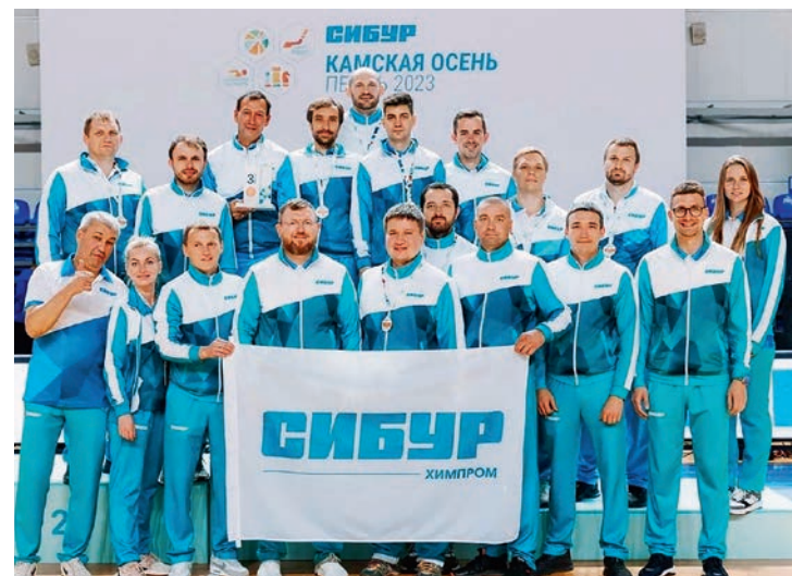
Осенние корпоративные соревнования «Камская осень»