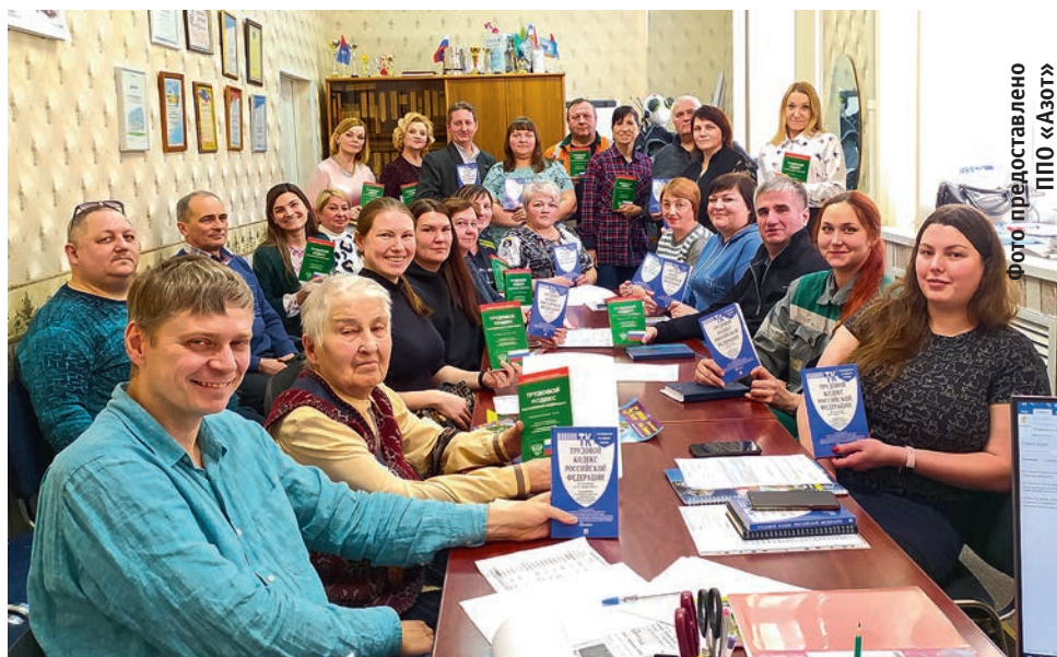
Профком ППО «Азот»

Предусмотрены и дополнительные оплачиваемые выходные дни для работников: при бракосочетании – два дня, на похороны близких родственников – три дня, родителям первоклассников – 1 сентября, дополнительный отпуск в зависимости от стажа работы на предприятии от двух до семи дней. Для сохранения здоровья будущих мам предприятие предоставляет додекретный отпуск не