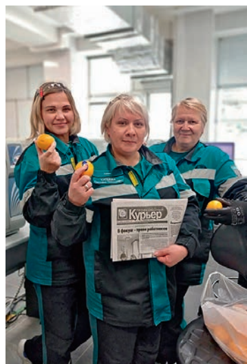
Акция «Витаминный бум»